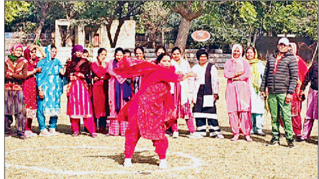
तोशाम। आयोजित प्रतियोगिता में दौड़ लगाती महिलाएं, चक्का फेंकती महिला तथा समापन अवसर पर विजेता प्रतिभाओं को सम्मानित करते हुए।