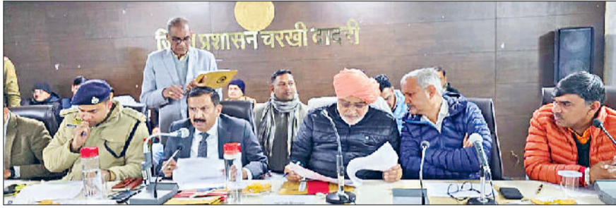
मिवानी। जिला लोकसंपर्क एवं परिवेदना समिति की बैठक में शिकायत सुनते मंत्री श्याम सिंह राणा।