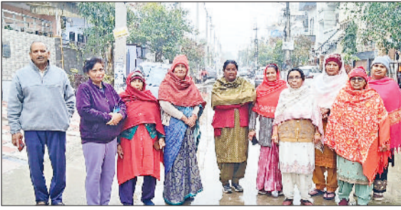
मिवानी। लेवलिंग की समस्या को लेकर एकत्रित क्षेत्रवासी।

शहर का वह इलाका जिसे कभी पाँश और आधुनिक सुविधाओं से लैस माना जाता था, आज प्रशासनिक अनदेखी और तकनीकी खामियों के कारण नरकोय जीवन जीने को मजबूर है। हम बात कर रहे हैं पार्षदों के बचत खाता, फिक्स्ड डिपॉजिट, एटीएम सुविधा, डेबिट कार्ड, मोबाइल एवं इंटरनेट बैंकिंग, केवाईसी सहित विभिन्न बैंक योजनाओं के बारे विस्तार से बताया गया। इसके अलावा ग्रामीणों को डिजिटल पेमेंट सिस्टम प्रति विशेष रूप से जागरूक किया।