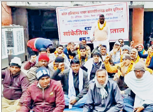
भिवानी। बिजली कर्मियों की एक दिवसीय सांकेतिक भूख हड़ताल के दौरान विरोध जताते कर्मचारी।