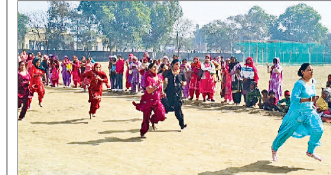
तोशाम। आयोजित प्रतियोगिता में दौड़ लगाती महिलाएं, चक्का फेंकती महिला तथा समापन अवसर पर विजेता प्रतिभाओं को सम्मानित करते हुए।