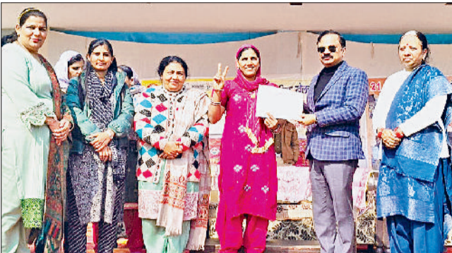
तोशाम। आयोजित प्रतियोगिता में दौड़ लगाती महिलाएं, चक्का फेंकती महिला तथा समापन अवसर पर विजेता प्रतिभाओं को सम्मानित करते हुए।