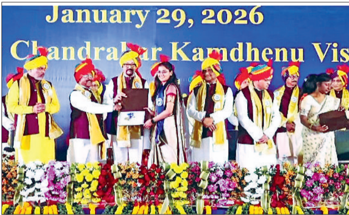
बहल। आयोजित कार्यक्रम में सुधीवास की बेटी को सम्मानित करते हुए।